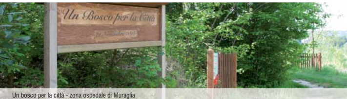
Un bosco per la città - zona ospedale di Muraglia

contenire l'uso dei mezz pubblici è stato modificato il percorso della linea Pesaro-Fano che attualmente attraversa i quartieri di Montegranaro-Muraglia raggiungendo Fano sia tramite la statale Adriatica sia percorrendo la strada panoramica Ardzio. Una particolare cura ed attenzione è stata rivolta alla gestione del verde pubblico presso parchi, giardini e scuole del territorio; nuovi arredi e giochi sono stati installati nel nuovo parco di via Kennedy, nel parco di Piazza Alfieri e presso il parco Scarpellini divenuto