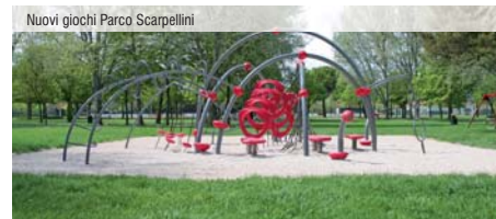
Nuovi giochi Parco Scarpellini

idrica nelle vie adiacenti. Per ciò che riguarda la sicurezza stradale, oltre alla realizzazione di marciapiedi, sono stati creati nuovi percorsi preferenziali per pedoni quali per esempio in via Milite Ignoto, Negrelli, Kennedy, sono stati installati dispositivi di controllo della velocità veicolare in via Lombroso e via Guer-rini (i cassonetti gialli denominati va-lentino) ed è stato messo in sicurezza con apposito spartitraffico l'incrocio pericoloso tra via Fratti e via Ferraris; inoltre per favorire ed in-