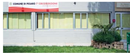
Nuova sede 7ª Circoscrizione

Nel settore "opere pubbliche", risultati significativi sono stati la realizzazione del nuovo centro civico di via Petrarca, con la nuova sede della circoscrizione ed i numerosi locali dedicati ad incontri pubblici, riunioni e convegni; sempre nella ex casa di riposo di via Petrarca sono stati ristrutturati i locali per i nidi d'infanzia "Arcobaleno", "Acquillone" ed il servizio per le famiglie "Primi Passi Uisp". Grazie alla vendita di un vecchio immobile comunale, sono stati reperiti i fondi sufficienti per la ristrutturazione del cam-