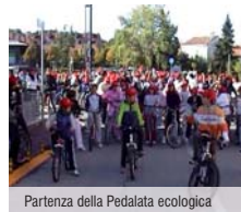
Partenza della Pedalata ecologica