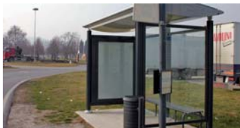
Nuova pensilina nella zona industriale di Villa Ceccolini