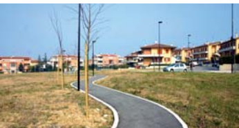
Pista ciclabile illuminata all'interno dell'area verde fra Strada Torcvia e Via Lago di Albano

In chiusura del mandato e al termine di un lungo percorso di partecipazione e confronto con istituzioni, associazioni e comitati di cittadini, è stato firmato il Patto di quartiere come strumento per una programmazione condivisa delle iniziative e per creare sinergie nell'utilizzo delle strutture.