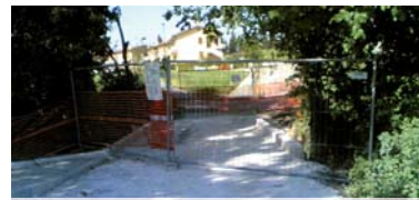
Lavori ricostruzione ponte e completamento strada Torcvia

Nel febbraio 2009 sono iniziati a Villa Ceccolini i lavori per la realizzazione della nuova palestra "Pala 3" . Il nuovo impianto sportivo polivalente permetterà ai bambini delle scuole, ai giovani e agli anziani del quartiere di fare attività sportive e ricreative facendo nascere, insieme al campo da calcio e alla pista polivalente di Via Lago di Misurina, un nuovo polo per lo sport libero e per la socialità. A fine aprile 2009, come ultimo intervento previsto dalla convenzione a carico dei privati lottizzanti, sono iniziati i lavori per sistemare il ponte e completare il tratto finale della strada Torcvia .