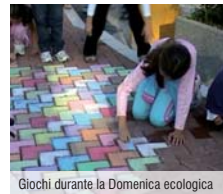
Giochi durante la Domenica ecologica

se, sostituzione del ponte di Via Risara con rotonda collegata al nuovo intervento di urbanizzazione, potenziamento dell'illuminazione in alcune zone e strade critiche).