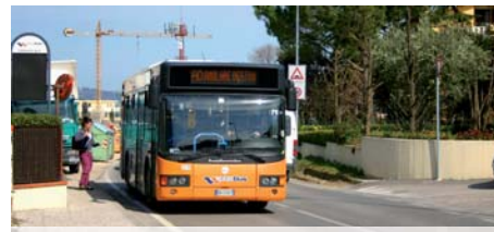
Nuova linea di trasporto pubblico "Anulare" di collegamento veloce con il centro città

In questi anni abbiamo lavorato insieme alle scuole, ai genitori, ai volontari e alle associazioni del quartiere per educare i cittadini ed in particolare i più giovani ai principi della solidarietà, all'importanza del volontariato e della partecipazione, al rispetto dell'ambiente. Ripartendo dalle attività organizzate con successo in questi anni, come la domenica ecologica, e dalle ampie prospettive aperte dal nuovo Patto di quartiere, vogliamo lavorare per ampliare i servizi pubblici scolastici e per il tempo libero, per collegare le due parti del quartiere attraverso nuovi percorsi ciclabili e pedonali e per rendere più sicuro e vivibile il nostro territorio. Per questo ci impegneremo a far crescere ancor di più il gruppo di volontari che già oggi si prendono cura delle aree verdi e della sicurezza dei bambini. Ci impegneremo, anche in collaborazione con i privati, per l'apertura nel quartiere di un nuovo